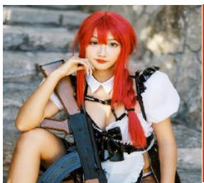
ポップカルチャー

日本文化を存分に楽しめるよう、阿波踊り、和太鼓など、迫力あるパフォーマンスをお楽しみください。